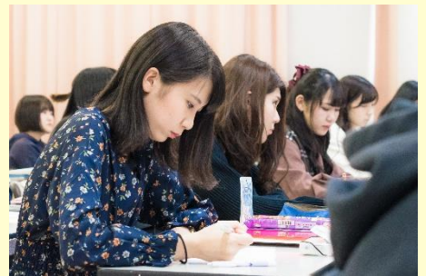
国家試験 対策講義