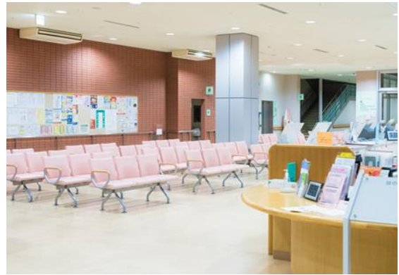
付属歯科病院1階 受付