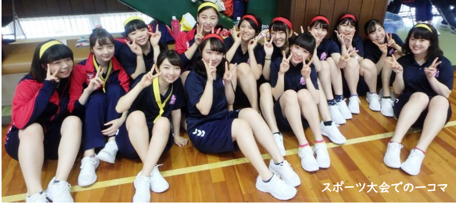
スポーツ大会での一コマ