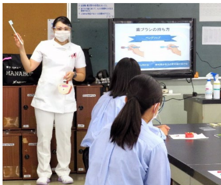
プロの歯磨きレッスンと ドキドキの咽頭吸引模擬実習