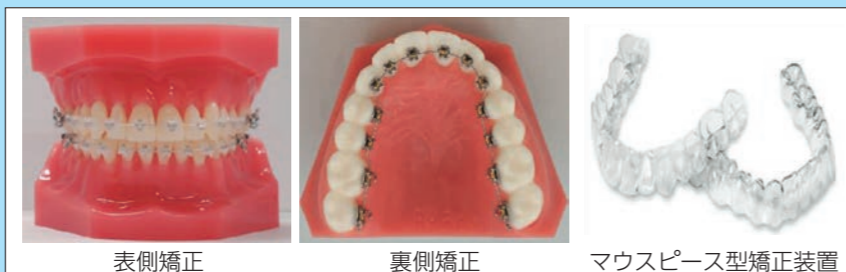
(写真2) 様々な矯正装置

また、矯正歯科治療の方法や使用する材料は日々進歩しています。患者さんのニーズにできるだけ対応することができるよう、当診療科には日本矯正歯科学会の認める認定医が多数在籍しております。そのため様々なジャンルの矯正治療に対応することができます。小さなお子さんの歯並びが心配な方には顎と歯並びの成長をコントロールするような矯正治療、成人の患者さんに対する目立たない矯正装置の選択や裏側矯正治療やマウスピース型矯正治療など(写真2)、大学病院の診療科による技術と知識に裏付けされた診療を提供しております。