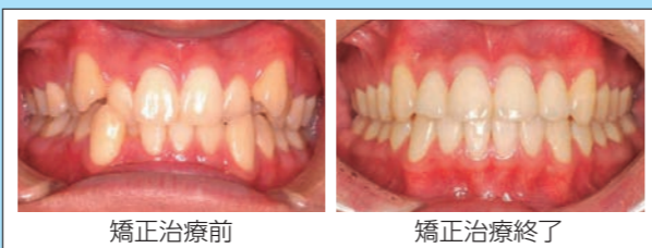
(写真1) 矯正歯科治療前後の歯並び

昨今は高齢化で口腔機能低下症などのリハビリテーションの話題が取り上げられることも多いですが、食生活の軟食化による低年齢の患者さんにも口腔機能の低下はおきており、それが歯並びを悪くする原因と考えられています。当診療科では歯並びだけでなく、顎顔面全体を視野にいた形態と機能の両立を治療方針としております。