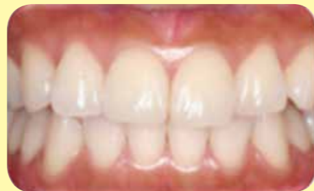
白く輝く美しい歯、歯周組織が安定している健康な歯肉

お口をリフレッシュさせ、美しく快適なライフスタイルを創るために、定期的に歯のクリーニングを受けることをおすすめしています。