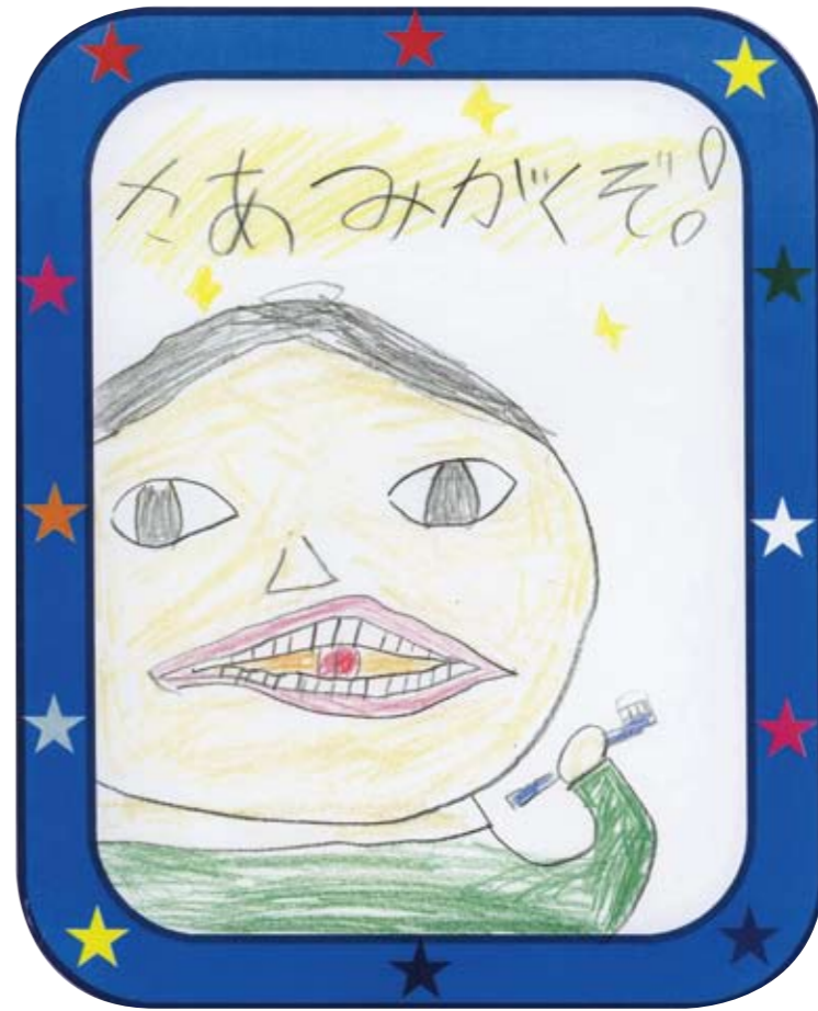
タイトル 大賞 まつい とうまくん(7さい)