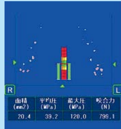
写真2 プレスケール検査

は口を開けるとクリックという音がする症例のMRIです。顎関節軟骨（関節円盤）が前方に転位しています。写真2はプレスケール検査で、噛みあわせの状態を客観的に評価できます。症例に応じては、咬合調整や補綴、矯正治療となりますし、口腔異常感の強い方には薬物療法が適応とされます。