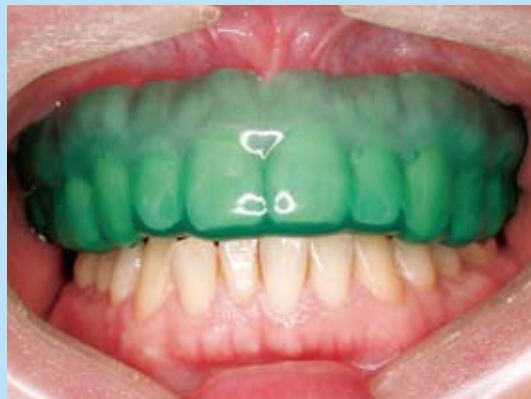
マウスガードを装着したところ

スポーツ健康歯科はスポーツアスリートだけでなくスポーツ愛する全ての方の歯の健康維持と外傷予防のためにマウスガードをお作りします。どうぞ遠慮無く受診ください。