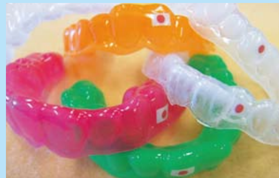
ソチオリンピック日本代表選手が実際に使用したマウスガード

これらスポーツは安全が一番ですが、ケガを防止しきれないのも事実です。中でも顔面や口の周囲のケガは外傷そのものの衝撃、痛みは当然のこと、衣服で覆うことのできない唯一の部分でもあり、本人ばかりでなく家族、関係者にとっても、顔の変形や審美性の欠如が与える心理的影響は計り知れません。また、食事摂取の問題もあり、より確実な安全対策が求められています。