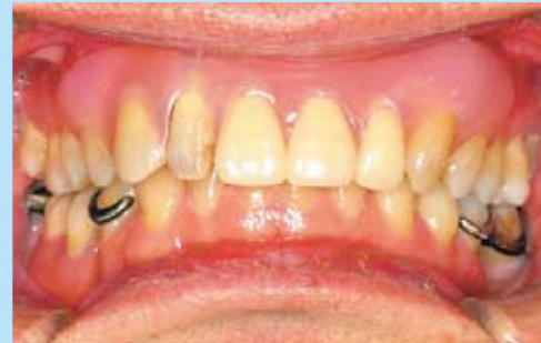
上あご：金具のない入れ歯を装着 下あご：金具のある入れ歯を装着